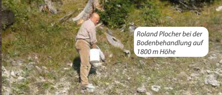
Roland Plocher bei der Bodenbehandlung auf 1800 m Höhe

Mit der ROLAND PLOCHER® integral-technik wird es möglich, den Bäumen gute Startbedingungen zu geben, damit diese ein starkes Wurzelwerk ausbilden können. Durch die Aktivierung des Bodenlebens im Pflanzbereich, können Aufforstungsprojekte erfolgreich umgesetzt werden. Sowohl kleine lokale Projekte als auch die großflächige Förderung von kräftigem, natürlichem Aufwuchs werden durch den Einsatz von von PLOCHER-Produkten für den Boden und die Baumpflege möglich.