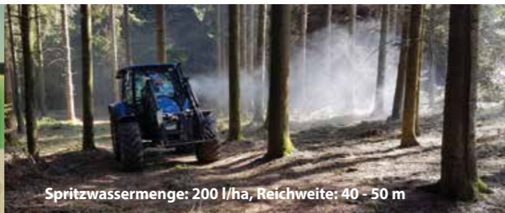
Spritzwassermenge: 200 l/ha, Reichweite: 40 - 50 m

Anwendungsbeispiel im Schwarzwald von Erich Lupfer: Maschinelles Ausbringen von plocher humusboden me mit einer Gebläsespritze.