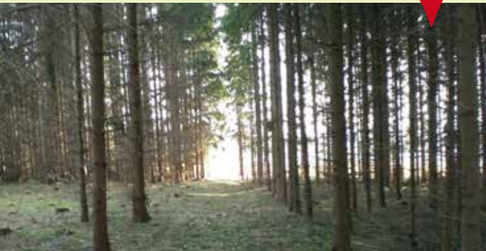
Kontrolle Fichten mussten gefällt werden, wegen starken Borkenkäferbefalls