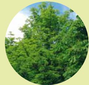
nach 3 Jahren mit PLOCHER

Ein weiteres Beispiel dafür, wie produktiv PLOCHER-Wurzelpflege sein kann: Der über 150-jährige Bergahorn war am Absterben. Dank des PLOCHER-Einsatzes konnte der Bergahorn gerettet werden.