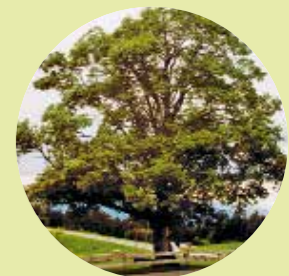
nach 2 Jahren mit PLOCHER